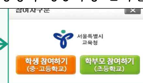
학부모참여하기 버튼 클릭

※ 검사 대상 : 초등학교 1학년, 4학년(학부모 중 1명만 참여합니다.)