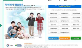
해당 시·도 선택