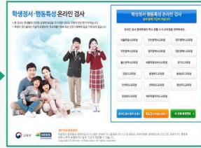
해당 시·도 선택