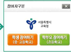
학부모참여하기 버튼 클릭